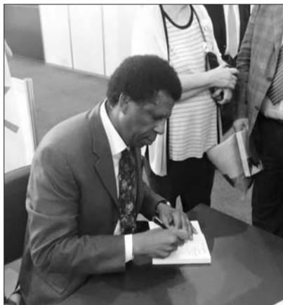
داني لافورير يوقع أحد مؤلفاته