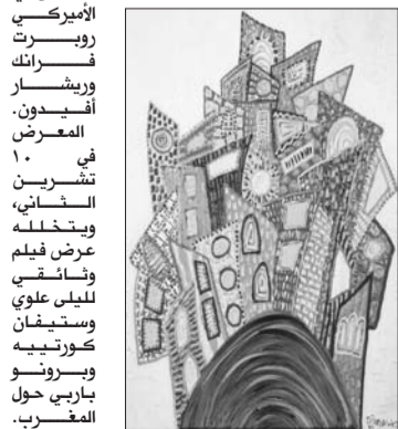
• نجاح سلام

وليلي علوي درست فن الصورة في جامعة نيويورك