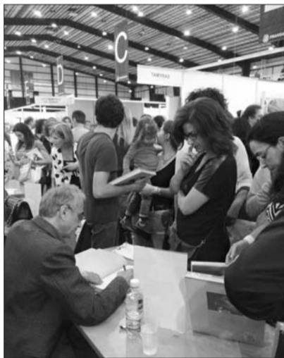
روبير بارد يوقع «كتاب الرسم»

شهد اليوم الأول وعند الثالثة من بعد الظهر محاضرة حول: «المغامرة الجغرافية من هيرجيه إلى ديريداء» تحدث فيها يونوا بيتز عن تجربته في هذا الإطار، وفي صالة المحاضرات رقم واحد، وحول طاولة مستديرة اجتمع كل من ستيفاني ناصيف وفدي درياس وإيمي شماس فيباني حول موضوع «الإرث الفينيقي: رسالة لقيم عالمية»، ودارت النقاش كلوديا شحادة. كذلك طاولة مستديرة حول موضوع «الجزرال دوغول ولبنان» اللبنانيون ودوغول» تحدث فيها كل من كلونيلد دو فوشيكور وكريم بيطار في «صالة جبران»، وهو ملخص كتاب دوفوشيكور الذي وقعته في اليوم الأول. وتتميز اليوم الأول بوفرة الندوات واللقاءات مع مؤلفين لمطرح