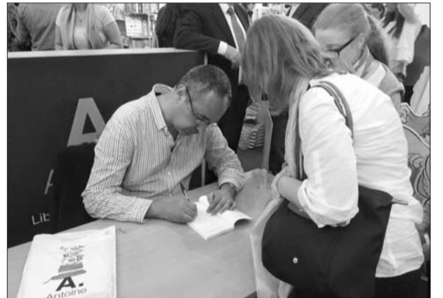
تواقيع كامل داود يوقع مورسو: تحقيق مضاد»