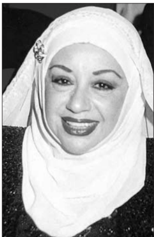
• نجاح سلام

دعا رئيس «المعهد الوطني للموسيقى» وليد مسلم، إلى حضور أمسية خاصة تحية وتكريماً للمطربة القديرة السيدة نجاح سلام، تحييها الأوركسترا الوطنية اللبنانية للموسيقى الشرق - عربية، بقيادة انطوان فرج، ومشاركة «كورال الغناء العربي في الكونسرفتوار».